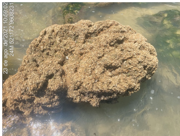
Figura 1 – Phragmatopoma caudata (recife-de-areia) Espécie Criptogênica Observada Durante o Monitoramento da Biota Aquática do Terminal Portuário de Pecém

Para o presente grupo (Epifauna) esta espécie compõe presença recorrente tanto temporal quanto espacial, estando registrada desde os monitoramentos pretéritos como em todas as campanhas do Programa de Monitoramento atual e, em todas as 05 áreas amostrais. Aparentemente sua presença não restringe a ocupação por outras espécies nativas, podendo ocorrer inclusive a associação com outros poliquetos, bem como, esponjas, moluscos e crustáceos (ARAÚJO, 2015). Essa consideração foi corroborada durante a 7ª CAMP, quando se obteve a presença de um molusco gastrópoda associado: Stramonita brasiliensis (caramujo, ) e nas 9ª e 12ª CAMP com o registro esporádico de indivíduos de Plagusia depressa (aratu-das-pedras).