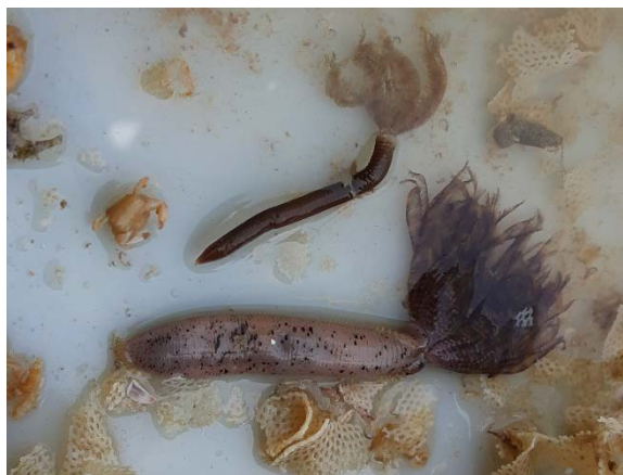
Figura 5 – Representantes de Sabellidae e Branchiomma sp. Observados Durante o Monitoramento da Biota Aquática do Terminal Portuário do Pecém

4) Licornia diadema , ascídia considerada exótica, foi registrada nas placas de recrutamento do TPP nos meses de fevereiro, maio e agosto de 2025, além da ocorrência já confirmada nas placas do CS Aratu, em novembro do mesmo ano. Na Bahia, a portaria estadual já a reconhece oficialmente como exótica e invasora, refletindo sua capacidade de colonização e potencial impacto sobre ecossistemas locais. No Ceará, embora ainda não haja regulamentação específica que a classifique como invasora, os registros sucessivos em áreas portuárias indicam a necessidade de atenção e monitoramento, visto que ambientes de intensa atividade marítima funcionam como pontos de entrada e dispersão de espécies não nativas.