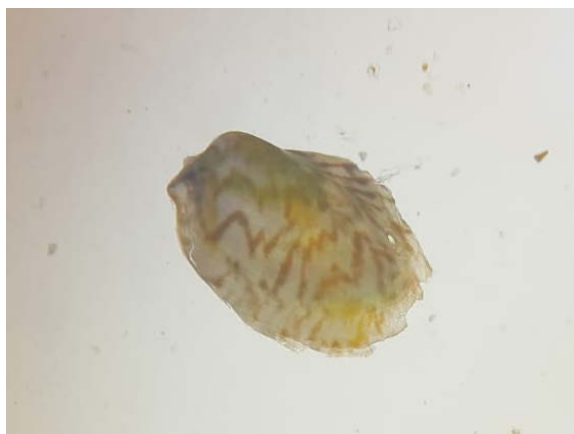
Figura 3 – Electroma vexillum . Espécie Exótica Observada nas Placas de Recrutamento Durante o Monitoramento da Biota Aquática do Terminal Portuário do Pecém

3) Electroma vexillum (Reeve, 1857) uma espécie exótica com distribuição original para o Oceano Índico (OLIVER, 1992) e o Mar Vermelho (DEKKER & ORLIN, 2000). A partir dos anos 2000, a espécie começou a ser encontrada e registrada em diversas partes do mundo, como o primeiro registro publicado no Mar Mediterrâneo em 2002 (ÇEVIC et al., 2005). No Brasil, os primeiros registros aparentam estar vinculados ao Porto do Pecém, no ano de 2023. Em 2024, sua presença já havia sido constatada no litoral do Rio de Janeiro e também no Paraná. No monitoramento atual do Porto do Pecém, as primeiras conchas foram observadas nas placas de recrutamento e continuaram a ser encontradas até a campanha de novembro de 2024, destacando-se ainda, que conchas também foram observadas nas amostras de infauna e bentos de fundo do presente monitoramento.