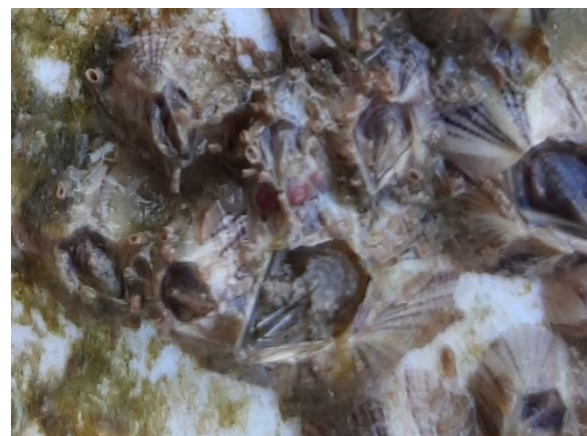
Figura 2 – Balanus amphitrite (craca-bolota) Espécie “Exótica” Observada Durante o Monitoramento da Biota Aquática do Terminal Portuário de Pecém

Dentre as Exóticas, para o monitoramento atual, ao longo das 17 campanhas realizadas, registra-se Balanus amphitrite (craca-bolota, [Figura 2]), espécie considerada nativa no Oceano Índico, ao sudoeste do Pacífico, foi introduzido em água tropicais, principalmente