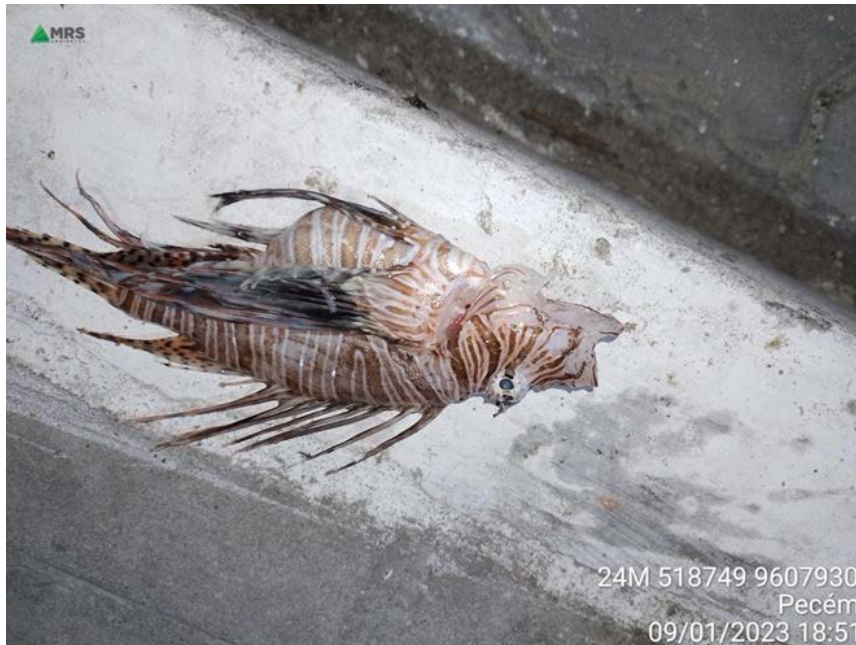
Figura 9 – Pterois sp. , espécie exótica observada por pescadores na área de estudo do Monitoramento de Biota Aquática do Terminal Portuário do Pecém.