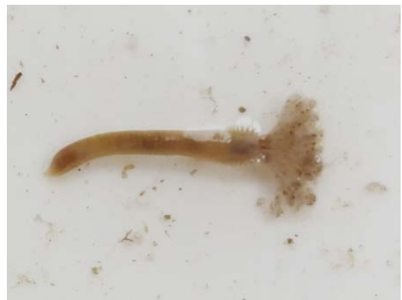
Figura 6 – Terceiro morfotipo de Sabellidae Observado Durante o Monitoramento da Biota Aquática do Terminal Portuário do Pecém

Ainda tratando-se de espécies não nativas, ressalta-se a ocorrência que foi apresentada de espécimes de poliqueta sabelídeo Branchiomma sp. da 8ª até a 12ª campanha. Embora tenha sido reportada a presença da exótica B. luctuosum e a nativa B. patriota , como o gênero comporta morfologia muito similar entre seus organismos, como pode ser visualizado nas Figura 5 e Figura 6 e, retoma-se, como critério técnico, manter todos os registros anteriores, atuais e futuros dentro do gênero afim de não consolidar uma informação errônea. Para tal, foram consultadas novas fontes científicas incluindo especialistas e, corroborando que seria mais sensato manter o nível gênero então estabelecido.