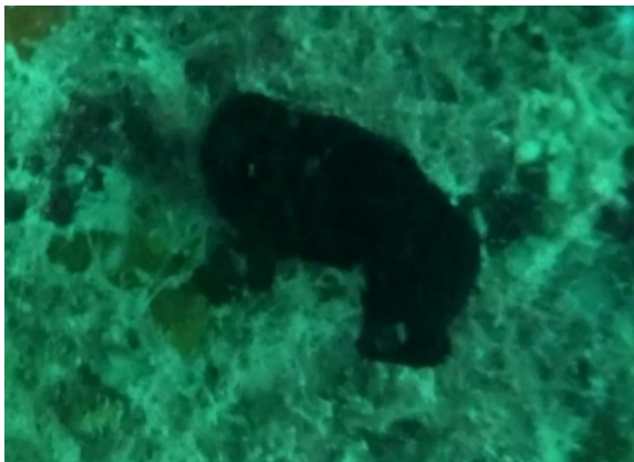
Figura 7 – Phallusia nigra (ascídia-negra) Espécie Criptogênica Observada Durante o Monitoramento da Biota Aquática do Terminal Portuário de Pecém

Nesta categoria cabe salientar as ascídias Phallusia nigra (Figura 7) e Botrylloides nigrum , (Figura 8) espécies que possuem ampla distribuição geográfica, sendo encontradas comumente em portos e marinas de todo o mundo e possivelmente representam antigas introduções na costa brasileira (NEVES, 2012).