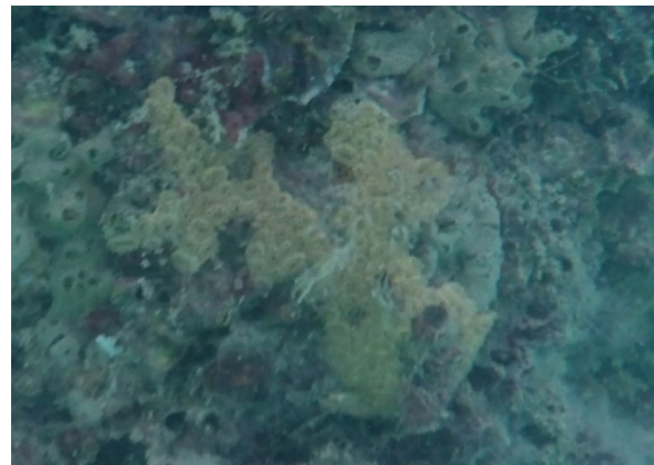
Figura 8 – Botrylloides nigrum (ascídia) Espécie Criptogênica Observada Durante o Monitoramento da Biota Aquática do Terminal Portuário de Pecém

Considerando-se os monitoramentos anteriores listam-se ainda o anelídeo Branchiomma luctuosum como espécie exótica já estabelecida em território brasileiro e a ascídia Styela canopus , denominada exótica nos Relatórios Anteriores do TTP, porém ainda classificada como espécie criptogênica pelo MMA (2009).